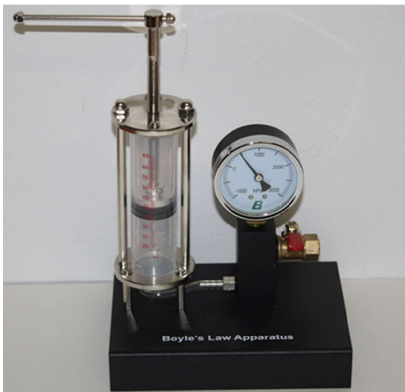
Рис. 1. Пристрій для вивчення газових законів

До програмного забезпечення супроводу вивчення дисципліни „Молекулярна фізика” відносяться симулятори фізичних процесів, засоби обробки та візуалізації отриманих даних вимірювань, засоби створення електронних освітніх ресурсів тощо. Вивчаючи термодинамічні ізопроцеси газів можна використовувати створену лабораторну установку (Рис. 1). При цьому, для обчислення отриманих результатів необхідно використовувати програмне забезпечення обробки табличної інформації.