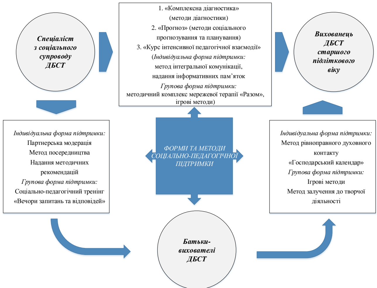
Рис. 1. Форми та методи соціально-педагогічної підтримки для формування готовності старших підлітків до самостійного життя в умовах ДБСТ

Перелічені форми та методи соціально-педагогічної підтримки, що спрямовані на формування готовності вихованців ДБСТ старшого підліткового віку до самостійного життя, систематизовано у вигляді схеми (рис. 1).